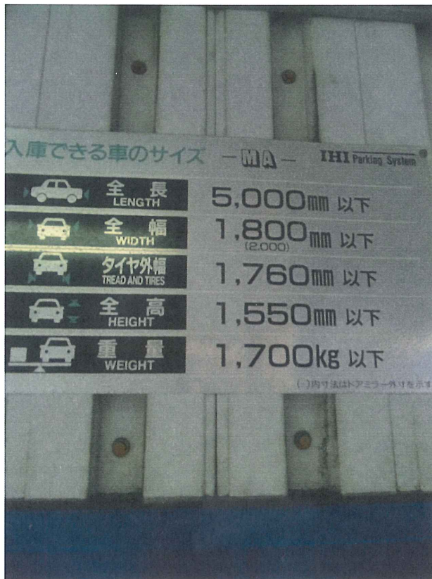
EL新大阪駐車場 サイズ