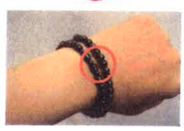
磁気ブレスレット