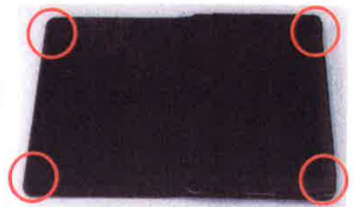
タブレットカバー